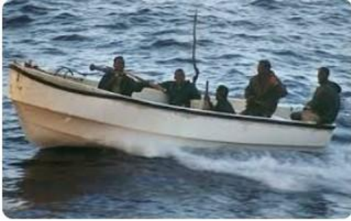
海賊・誘拐がソマリアの主要産業に：今年の「儲け」はすでに30億 ...

が先進国の漁船に荒らされ漁業で生活できなくなったからとか、身代金を武装闘争の資金源にするためとも言われているが、根底には、海賊を生業にするしかない経済状況と、犯罪を取り締まる機能のない無政府状態がある。