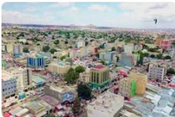
ソマリランドの首都ハルゲイサ

ソマリア政府は1991年の独立を認めなかったが、ソマリランドはその後約20年間続いたソマリア内戦の混乱の中で、独自の軍隊と通貨を保有し、大統領選挙を含む様々な選挙を単独で実施しながら、独立政府を運営してきた。治安状況もソマリア本土より安定しているという評価を受け、地域内には“一つの国家として認められる資格がある”という声が継続的に上がってきた。