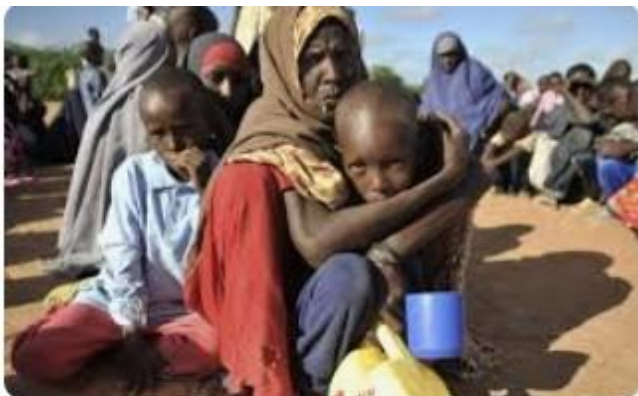
多くのソマリア難民、ケニアへ避難を続ける | UNHCR 日本

ソマリランドの大統領府は声明で“国際的な正当性を求めてきたソマリランドにとって一里塚になる”と歓迎し、イスラエルとの国交樹立を通じて“中東・アフリカ地域の平和に貢献する”と強調した。