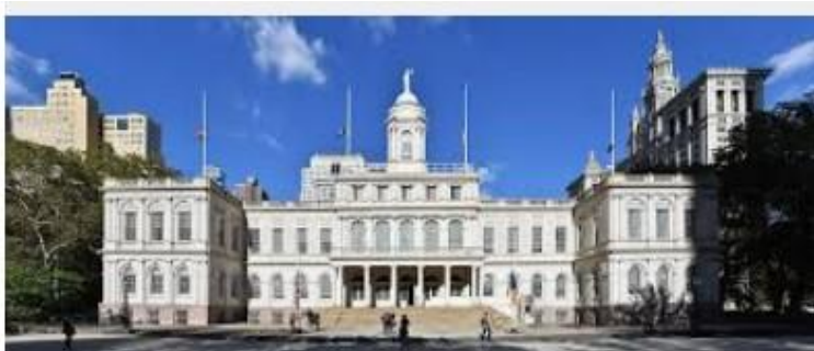
ニューヨークの市庁舎

トランプ大統領はマムダニ氏を“共産主義者”と呼んでおり、市長就任の場合には連邦予算の削減を示唆している。しかし連邦議会が予算の権限を持つため、大統領が直接決定できるわけではないので政治的駆け引きであろう。