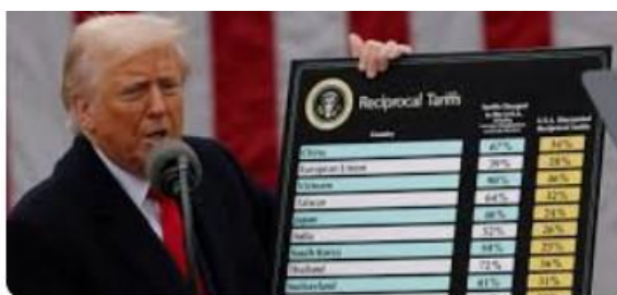
トランプ関税の合憲性、米最高裁が疑問呈す口頭弁論開始 | ロイター

来年の中間選挙に向けて大きな影響を及ぼすであろう問題は“トランプ関税”の合憲性であろう。11月5日、アメリカの最高裁判所でトランプ政権による関税措置の合法性を巡る口頭弁論が行われた。これはトランプ氏が国際緊急経済権限法（IEEPA）に基づいて発動した広範な関税措置の合憲性を問うもので、その判決は企業や貿易相手国に大きな影響を与える可能性がある