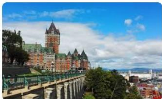
ケベック歴史地区 | カナダ | 世界遺産オンラインガイド

7月に上陸、この地をカナダと名付け、フランス領にすると宣言した。フランスは更に1603年、アンリ4世の時に植民地カナダを成立させた。次いでセント