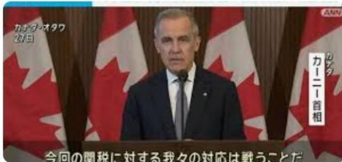
カナダ首相「あらゆる手段を講じる」米の“自動車追加関税”受け...