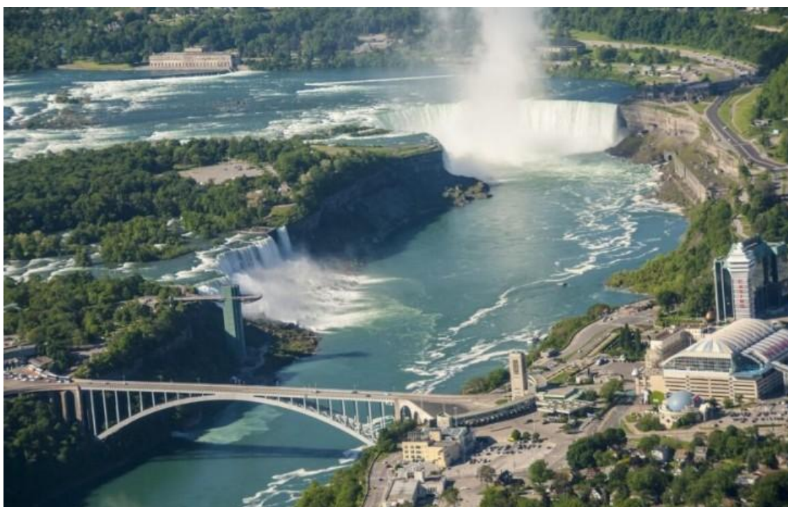
ナイアガラの滝 右側がカナダ側、橋の下付近から滝の観光船が出る

小生はカナダに仕事や休暇で数回行っているが、休暇の時はレンタカーでカナダ各地の氷河や湖を3000キロ以上走破した。何所もその自然の美しさに圧倒される思いだった。何となしにカナダを応援したい気持ちになる。