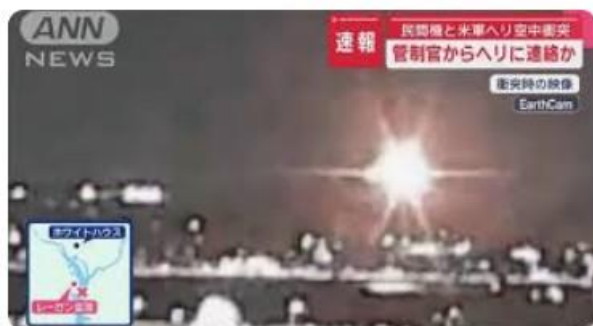
速報】米・ワシントン近郊 民間機と米軍ヘリ空中衝突 管制官から

一般的に民間機と軍用機では交信に使う電波の周波数が違うため、管制官を経由しないとお互いの動きを把握できない事実がある。だからこそ、管制官の指示に従うことが非常に大事である。