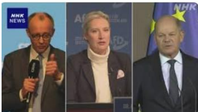
CDU, AfD、SPD の各党首

連立協議後も政権運営は綱渡りだ。AfD が初めて第2党に浮上し、最大野党になる。総選挙で躍進した旧共産党系の流れをくむ左派党と AfD で合わせて議会全体の3分の1の議席を握る。ドイツで憲法に相当する基本法の改正には議会の3分の2の賛成が必要になる。財政赤字を一定の規模に抑える“債務ブレーキ”は基本法で規定している。厳格な財政ルールの手直しなどを決めるには野党を含めて合意を得なければいけない。