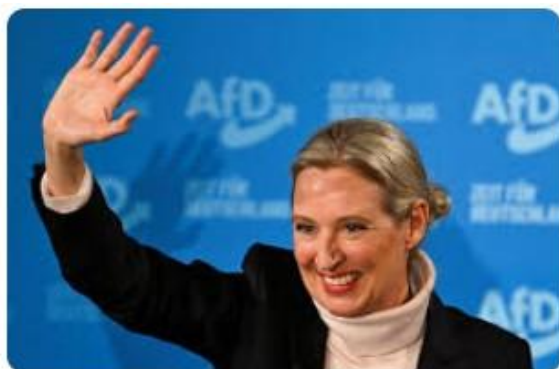
ドイツの「極右」AfD、連邦議会で第2党 確実に 総選挙で現地報道 ...

そして“重要なのはドイツに再び行動のできる政府をできるだけ早く作ることだ。世界は私たちが待ってはくれない”と述べ、速やかに政権の枠組みを決める連立協議を始めたいという考え方を示した。